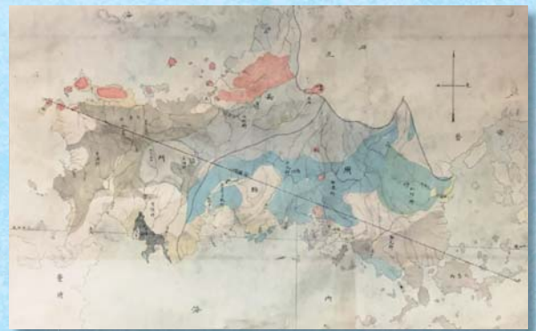
高島北海「山口県地質分色図」(山口県文書館蔵) 前期展示