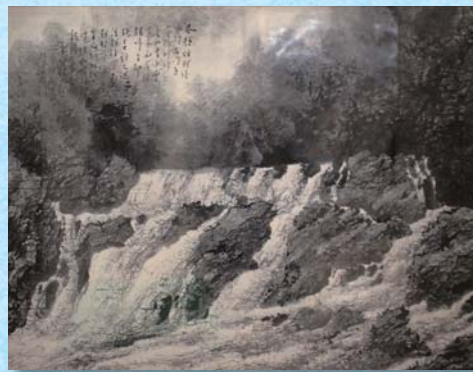
松林桂月「長門峡」(個人蔵 山口県立美術館寄託) 後期展示